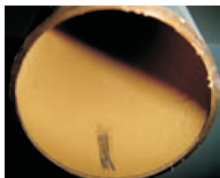
Měděné potrubí zanesené fyzikálními nečistotami