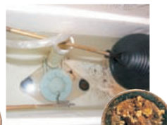
Pět let stará budova „B“ nemá žádný filtr. V nádržce toalety a perlátoru je možné vidět rez a usazeniny