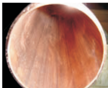
Měděné potrubí tak, jak by mělo vypadat!