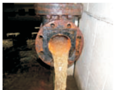
Tento snímek byl pořízen při výměně vodoměru.

Městské čističky vody odvádějí jedinečnou práci v oblasti čištění, filtrace a zásobování vodou. Bohužel v okamžiku, kdy voda vstoupí do podzemních sítí (infrastruktury), které distribuují vodu do našich domovů, opět začne docházet k jejímu znečišťování.