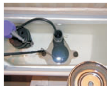
Při stavbě budovy „A“ před sedmi lety byl instalován filtr JUDO PROFIMAT. Nádržka toalety i perlátor jsou bez rzi a usazenin.