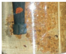
Záběr fyzikálních nečistot zachycených filtrem JUDO