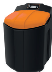
Typ Bioquell®-SOFT 40