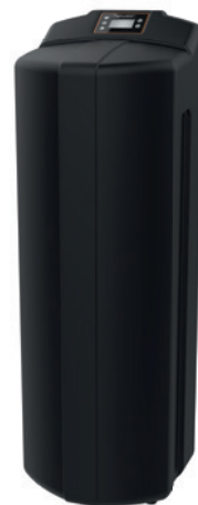
Typ Bioquell®-CLEAR 250