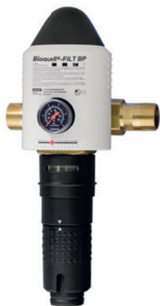
Typ Bioquell®-FILT BP 3/4" - 1 1/4"