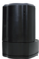
Typ FILT-A (přídavná automatika)