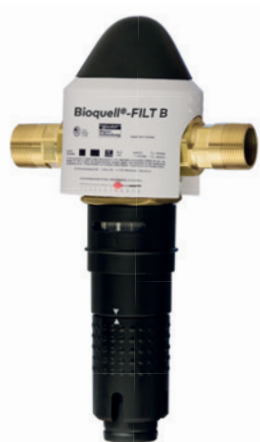
Typ Bioquell®-FILT B 3/4" - 1 1/4"